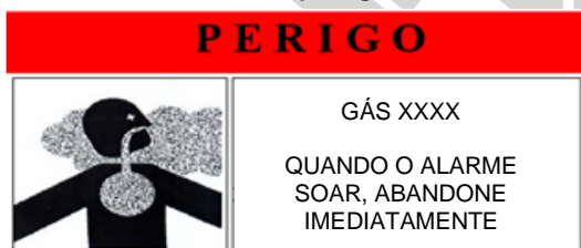
Figura 1 – Sinalização de advertência para interior dos ambientes protegidos

5.8 Nos ambientes protegidos por sistemas fixos de gases, devem ser fixados, interna e externamente nas portas do ambiente protegido, placas de sinalização de advertência para o risco, conforme Figura 1 e Figura 2, especificando-se o nome do agente gasoso empregado. As placas de sinalização devem atender os requisitos da NT 2-05 – Sinalização de segurança contra incêndio e pânico.