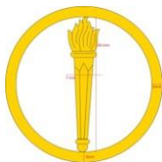
Fig.7 - Modelo de distintivo de gola referente à Praça Combatente Temporária.

Exemplo: Praça Combatente Temporária - um facho, com 30mm de altura por 7mm de largura, no interior de dois círculos concêntricos vazados de medidas com 15 e 18mm de raio, respectivamente: