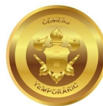
Fig.4 - Estágio de Formação de Oficiais Temporários

a) Estágio de Formação de Oficiais Temporários, com comprimento longitudinal de 45mm e largura de 45mm, sendo o símbolo do CBMERJ posicionado no interior de 2 círculos concêntricos e na parte superior, entre os círculos, a denominação “CBMERJ”; na parte inferior, a denominação “TEMPORÁRIO”: