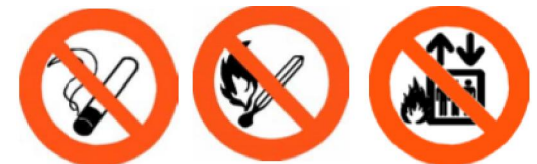
Fonte: NBR 13434 – Sinalização de segurança contra incêndio