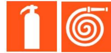
Fonte: NBR 13434 – Sinalização de segurança contra incêndio