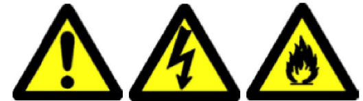
Fonte: NBR 13434 – Sinalização de segurança contra incêndio